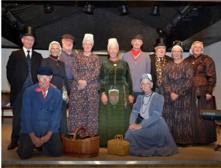
De Skroiversgroep Veenhuizen