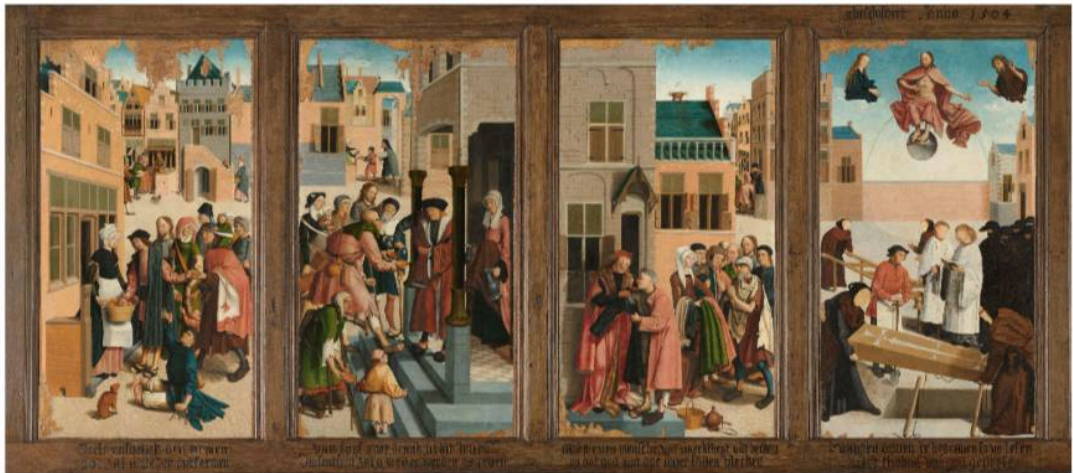
Rijksmuseum Amsterdam, Meester van Alkmaar, 1504

U kunt via de vastenactie en de vastenkaart ook gedurende de hele 40-dagentijd meesparen voor dit project. ( https://kerkinactie.protestantsekerk.nl/ideeenbank/vast-mee-in-de-40dagentijd )